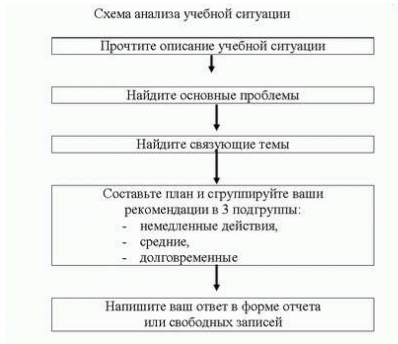
Схема анализа учебной ситуации

Шкала и критерии оценивания результата учебной ситуации, выполненной обучающимися, представлены в таблице